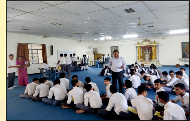
विद्यालय में निःशुल्क नेत्र परीक्षण कराते छात्र-छात्राएं