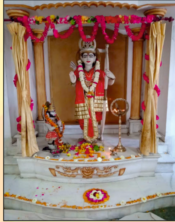
नमामि रामं रघुवंश नाथम्