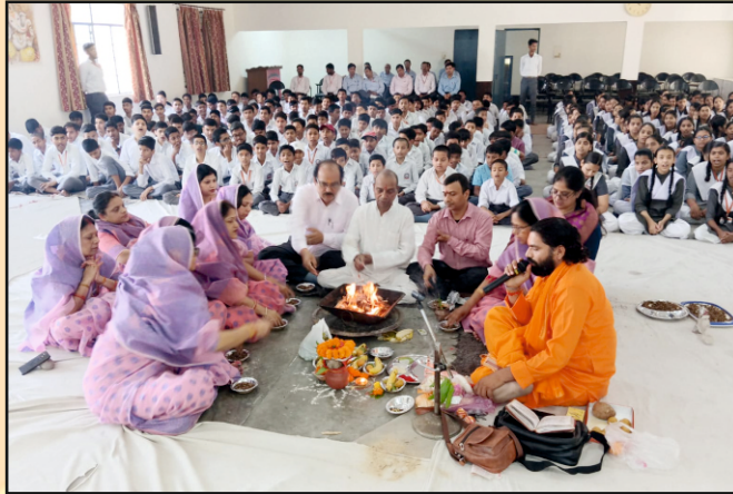
हवन पूजन करते हुये प्रधानाचार्य, आचार्य एवं बच्चे