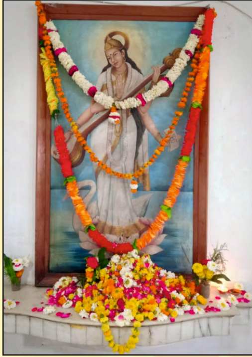
वर दे वीणा वादिनि