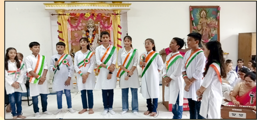
स्वतंत्रता दिवस के अवसर पर समूह गीत प्रस्तुत करती हुई विद्यालय की छात्राएँ