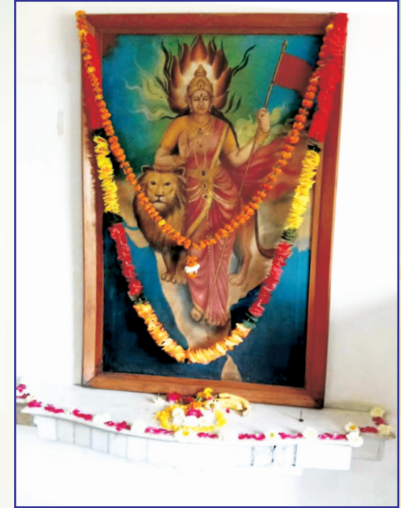
नमामि भारत जननीम्