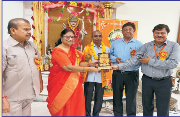
भारत विकास परिषद द्वारा प्रधानाचार्य जी का नागरिक अभिनन्दन करते हुए संस्था के पदाधिकारीगण