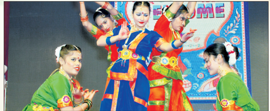
सांस्कृतिक कार्यक्रम प्रस्तुत करती हुई विद्यालय की छात्रायें