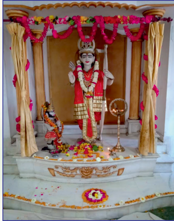
नमामि रामं रघुवंश नाथम्