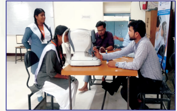
स्वास्थ्य परीक्षण शिविर में विशेषज्ञों द्वारा आँखों का परीक्षण कराती विद्यालय की छात्रायें