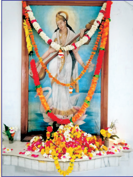
वर दे वीणा वादिनि