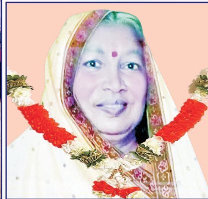
पुण्यात्मा स्व. माँ जुगलदेवी