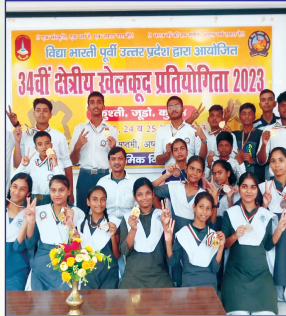
विद्या भारती पूर्वी उत्तर प्रदेश द्वारा आयोजित 34वीं क्षेत्रीय खेलकूद प्रतियोगिता - 2023 के समापन समारोह में पुरस्कृत विद्यालय के प्रतिभावान छात्र / छात्रायें।