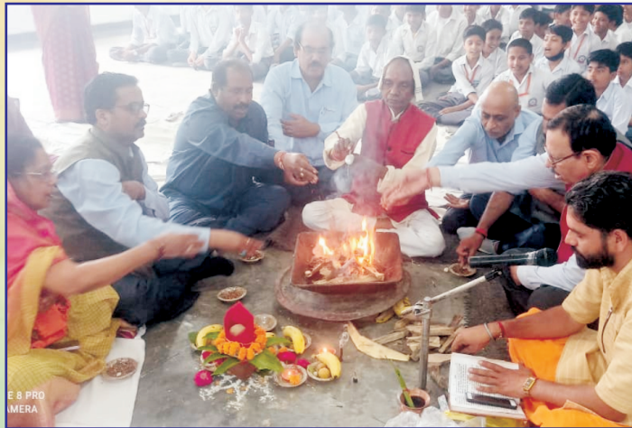
हवन पूजन करते विद्यालय के प्रधानाचार्य, आचार्य एवं शिक्षार्थी