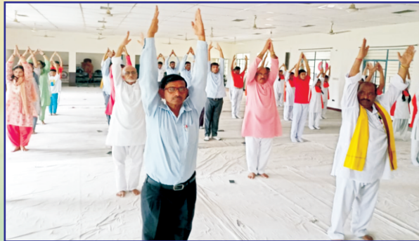
21 जून 2023 (अन्तर्राष्ट्रीय योग दिवस) के अवसर पर योग करते हुए विद्यालय के आचार्य गण एवं छात्र / छात्रायें।