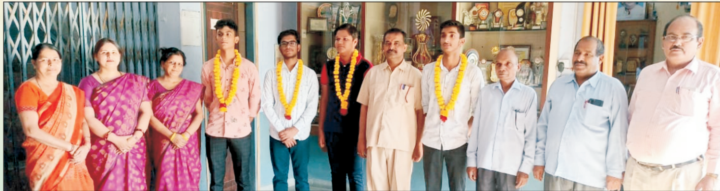
सी.बी.एस.ई. बोर्ड परीक्षा में उत्कृष्ट प्रदर्शन करने वाले भैया-बहिन, प्रधानाचार्य, आचार्य एवं आचार्या

षष्ठ से अष्टम तक की छात्राओं का वेश सफेद सलवार कुर्ता हरा दुपट्टा एवं नवम-दशम की छात्राओं का सफेद सलवार, कुर्ता व नारंगी दुपट्टा तथा एकादश-द्वादश की छात्राओं का सफेद सलवार, कुर्ता और पीला दुपट्टा रहेगा। प्रत्येक विद्यार्थी को निर्धारित वेश में ही आना आवश्यक है। निर्धारित वेश में न आने पर छात्र/छात्रा को आर्थिक दण्ड दिया जा सकता है अथवा घर लौटाया जा सकता है।