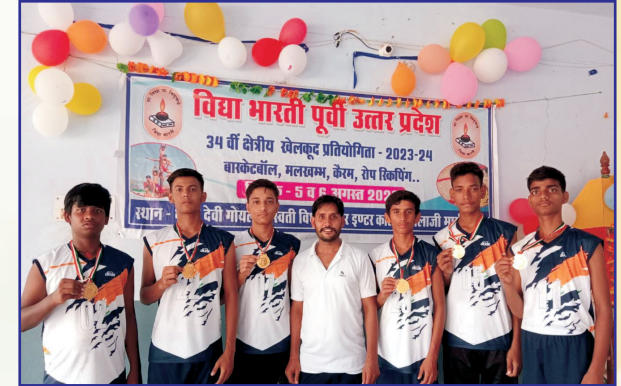
उत्तर प्रदेश क्षेत्रीय खेलकूद प्रतियोगिता में प्रतिभागी खिलाड़ी एवं कोच