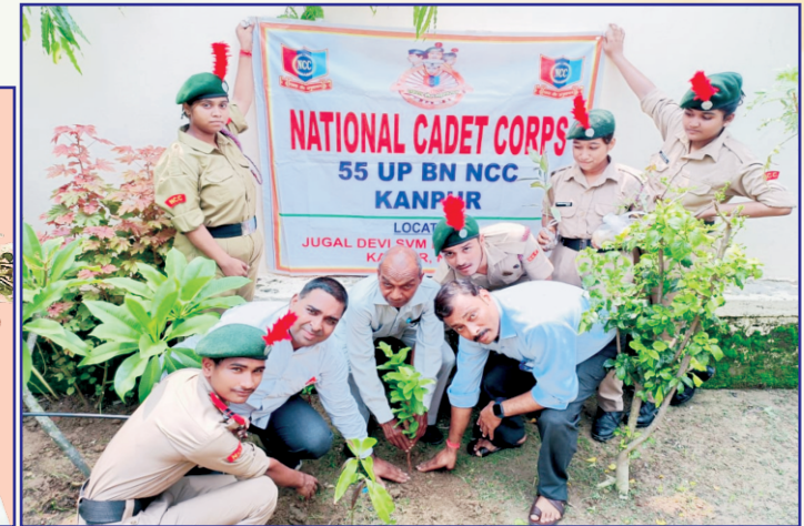
पर्यावरण दिवस पर वृक्षारोपण करते हुए विद्यालय के प्रधानाचार्य जी, आचार्य एवं N.C.C. के ऊर्जावान कैडेट्स