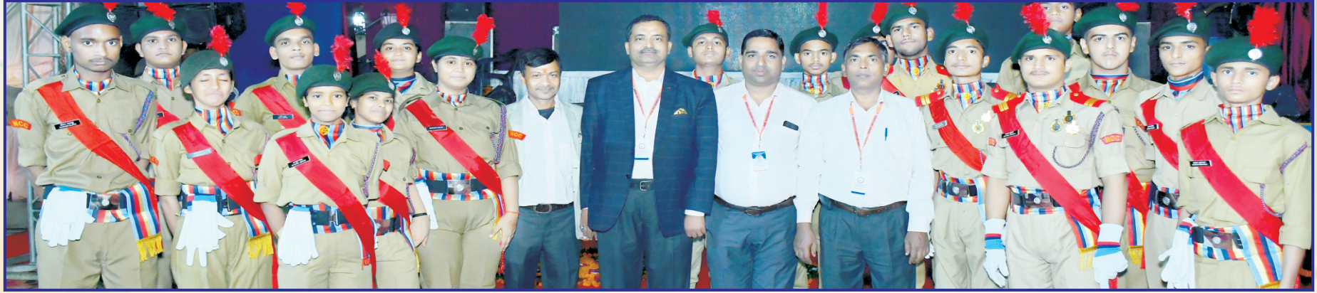
विद्यालय की राष्ट्रीय कैडेट कोर (एन.सी.सी.) के ऊर्जावान कैडेट्स के साथ आचार्यगण